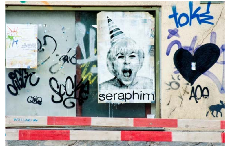
Gerhard Moderitz: der Schrei