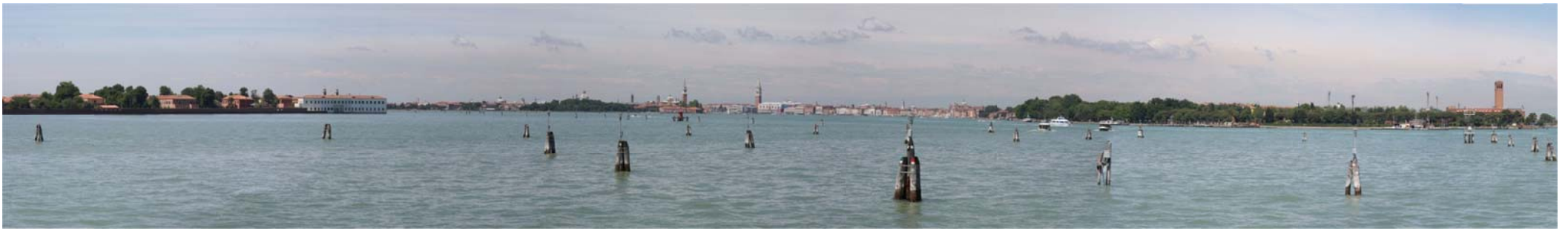
Hanspeter Moderitz: Venedig ( Panorama 160x30 cm)