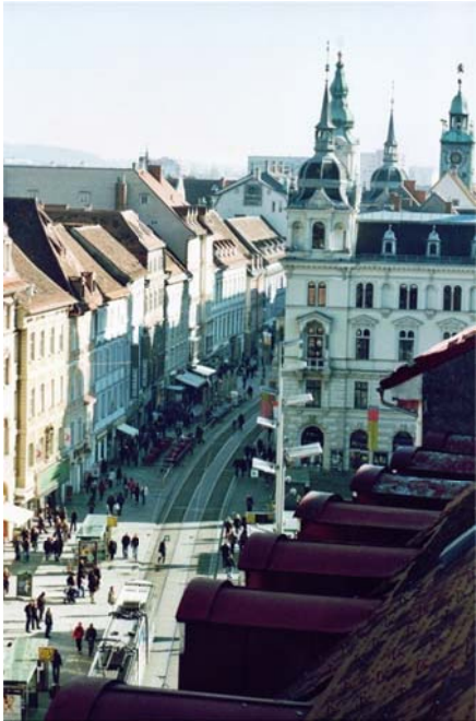
Günther Scheucher: Blick in die Herrengasse