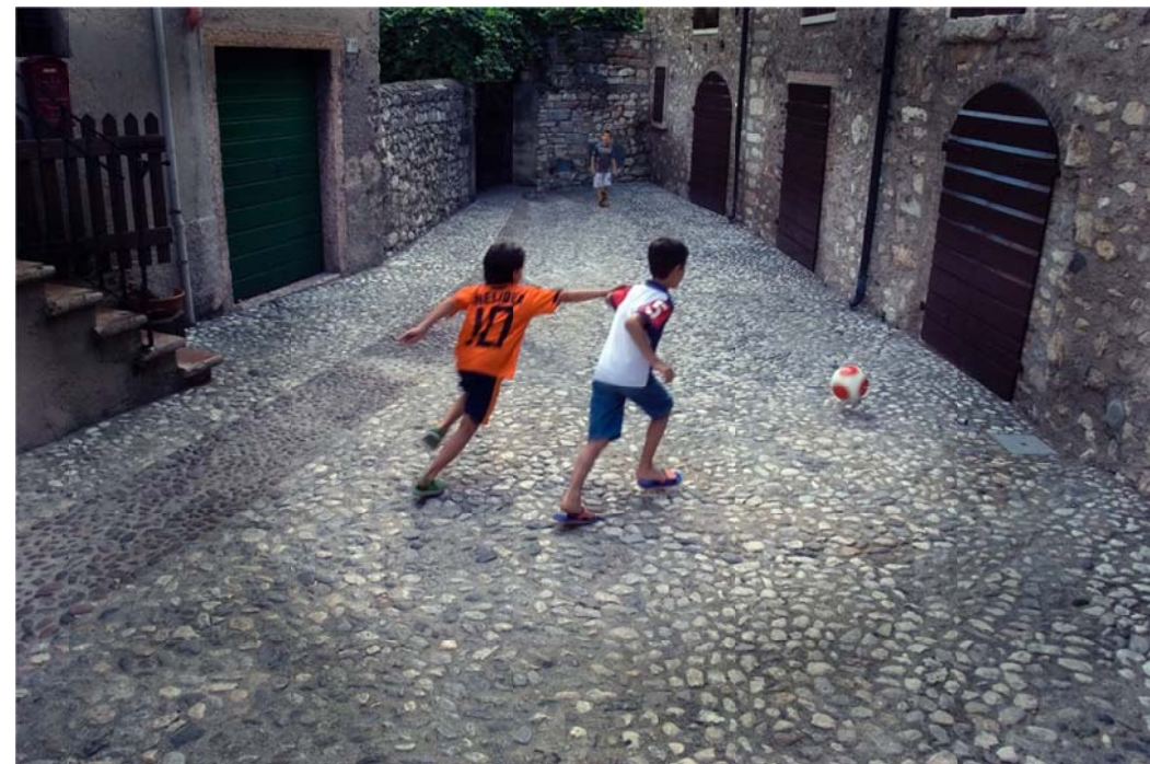
Dr. Franz Pacher: Ballspielende Jungs

Zeitschrift des Clubs der Amateurfotografen Graz Mitglied im VÖAV – Verband Österreichischer Amateurfotografen-Vereine Mitglied der FIAP