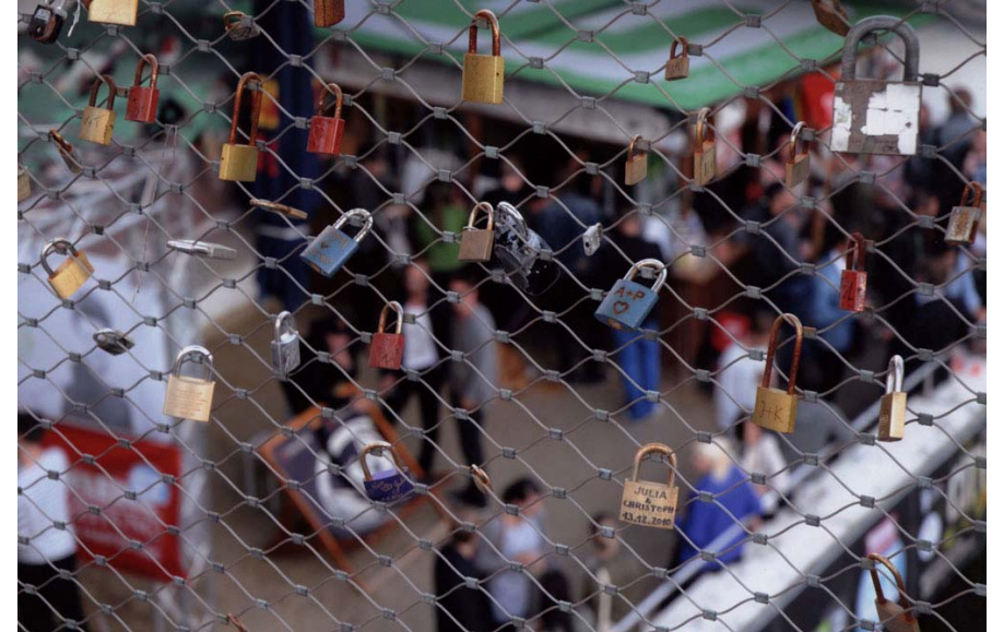
WOLFGANG WEISS: HINTER GITTER