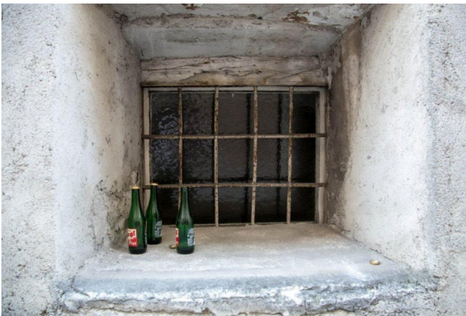
CHRISTIAN LEGRCHBACHER: TRINKGELAGE