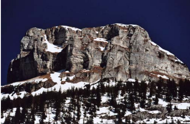
GÜNTER SCHEUCHER: LOSER