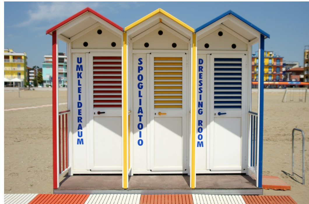
Gerhard Moderitz: Badehütten, Caorle (IT)

Mitglied im VÖAV – Verband Österreichischer Amateurfotografen-Vereine Mitglied der FIAP