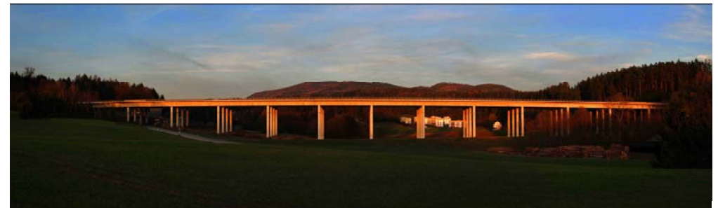
Dr. Franz Pacher: Autobahnbrücke bei Gratkorn (Panorama)

Zeitschrift des Clubs der Amateurfotografen Graz Mitglied im VÖAV – Verband Österreichischer Amateurfotografen-Vereine Mitglied der FIAP