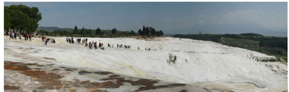
Gerhard Moderitz: Pumukkale (Panorama)