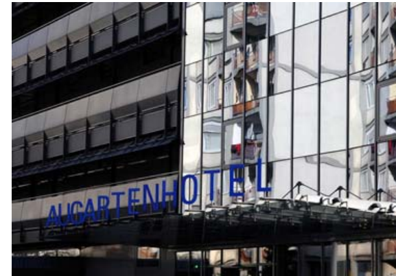
Wolfgang Weiss: Augartenhotel