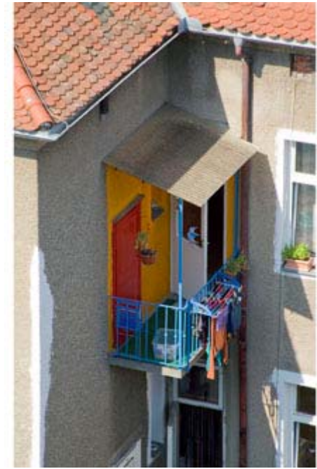
Caifen Liang-Pacher: Klosterwiesgasse