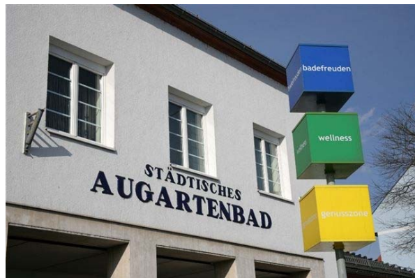
Erich Kaufmann: Augartenbad