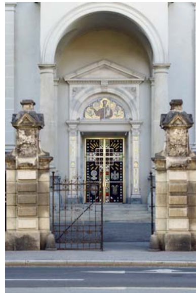
Gerhard Moderitz: Josefskirche