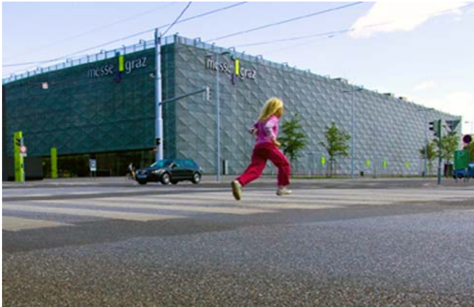
Hanspeter Moderitz: messe graz