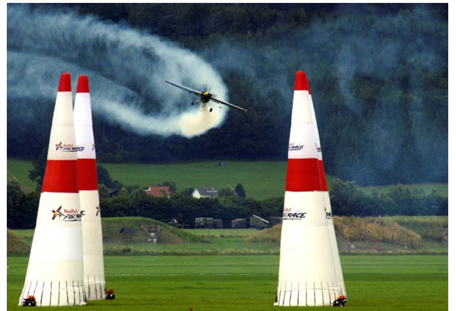
Gerhard Moderitz: Airpower 2009