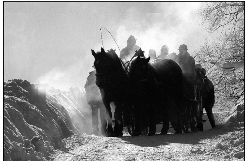
Wolfgang Scheuer: Schlittenfahrt

Zeitschrift des Clubs der Amateurfotografen Graz Mitglied im VÖAV - Verband Österreichischer Amateurfotografen-Vereine Mitglied der FIAP