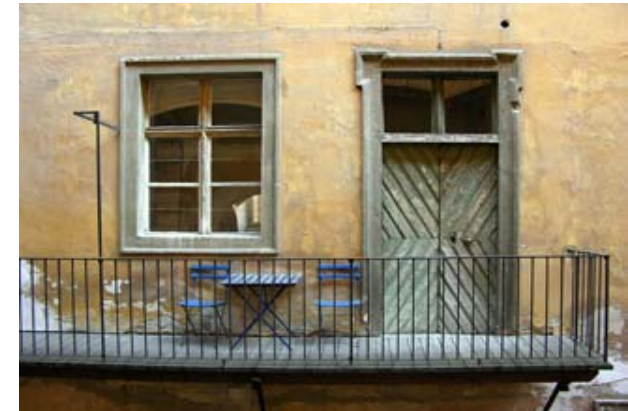
Wolfgang Weiss: Hinterhof (Graz)