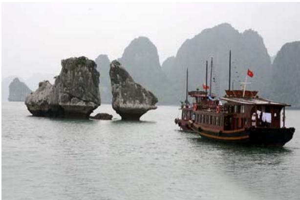
Erich Kaufmann: Vịnh Hạ Long