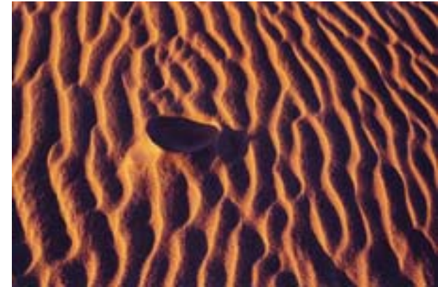
Franz Pacher: Spuren