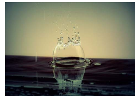
Vesnja Špoljar (HR)