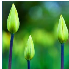
Malu Schwizer (FL)