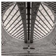
Dietmar Walser (FL)