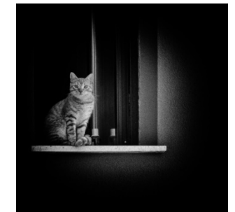
Othmar Doppelhofer (AT)